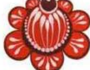
Орнамент в полосе