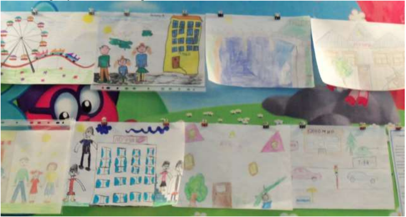
Маршрут от дома до детского сада.